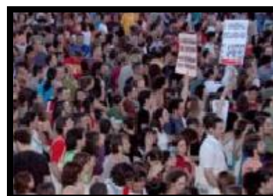
Manifestación por un mundo sin muros

La próxima edición del Foro Social Mundial de las Migraciones tendrá lugar en octubre de 2010 en Quito, Ecuador.