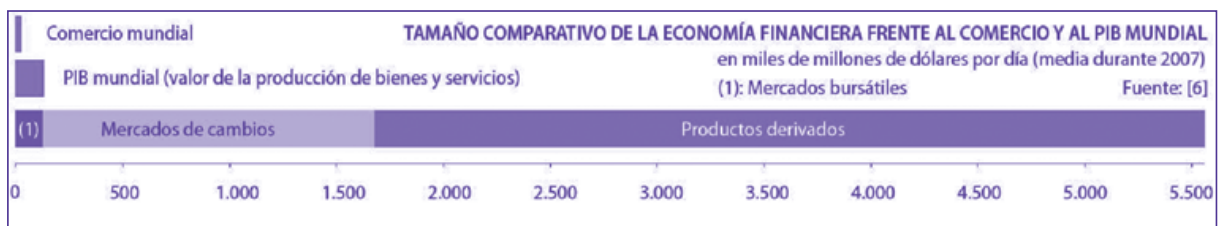
Gráfico 7. Tamaño comparativo de la economía financiera frente al comercio y al PIB mundial