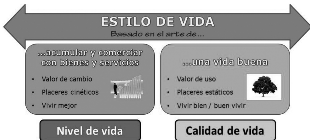
Gráfico 1. Esquema conceptual de los diferentes usos terminológicos que giran en torno al estilo de vida y sobre los cuales suelen producirse confusiones