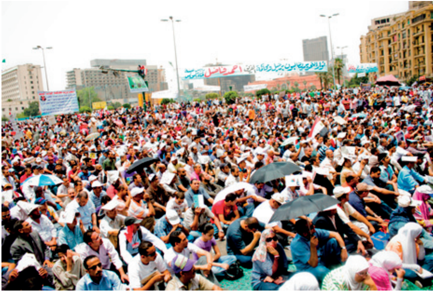
Protesta en la plaza Tahrir.

“Fue todo menos el azar, lo que sacó a millones de egipcios a la calle”, escribe Tahar Ben Jelloun en su libro La primavera árabe. El despertar de la dignidad . Aunque no se puede meter todo en el mismo saco, seguramente la apreciación del escritor franco-marroquí es extensible a otras revueltas. En todos los casos, lo que apareció como noticia insólita se llevaba gestando a lo largo de años, de décadas, tal vez de siglos; y esto es válido tanto en relación a las causas que lo provocaron como a las circunstancias que lo hicieron posible . La visión distorsionada que nos llega de los países árabes, junto a una comunicación mediática que suele reducir los procesos a sucesión de hechos, sin excluir significativos –¿interesados?– silencios informativos, contribuye a que nos haya sorprendido la erupción de un volcán sin que nos hubiéramos percatado ni tan siquiera de su existencia.