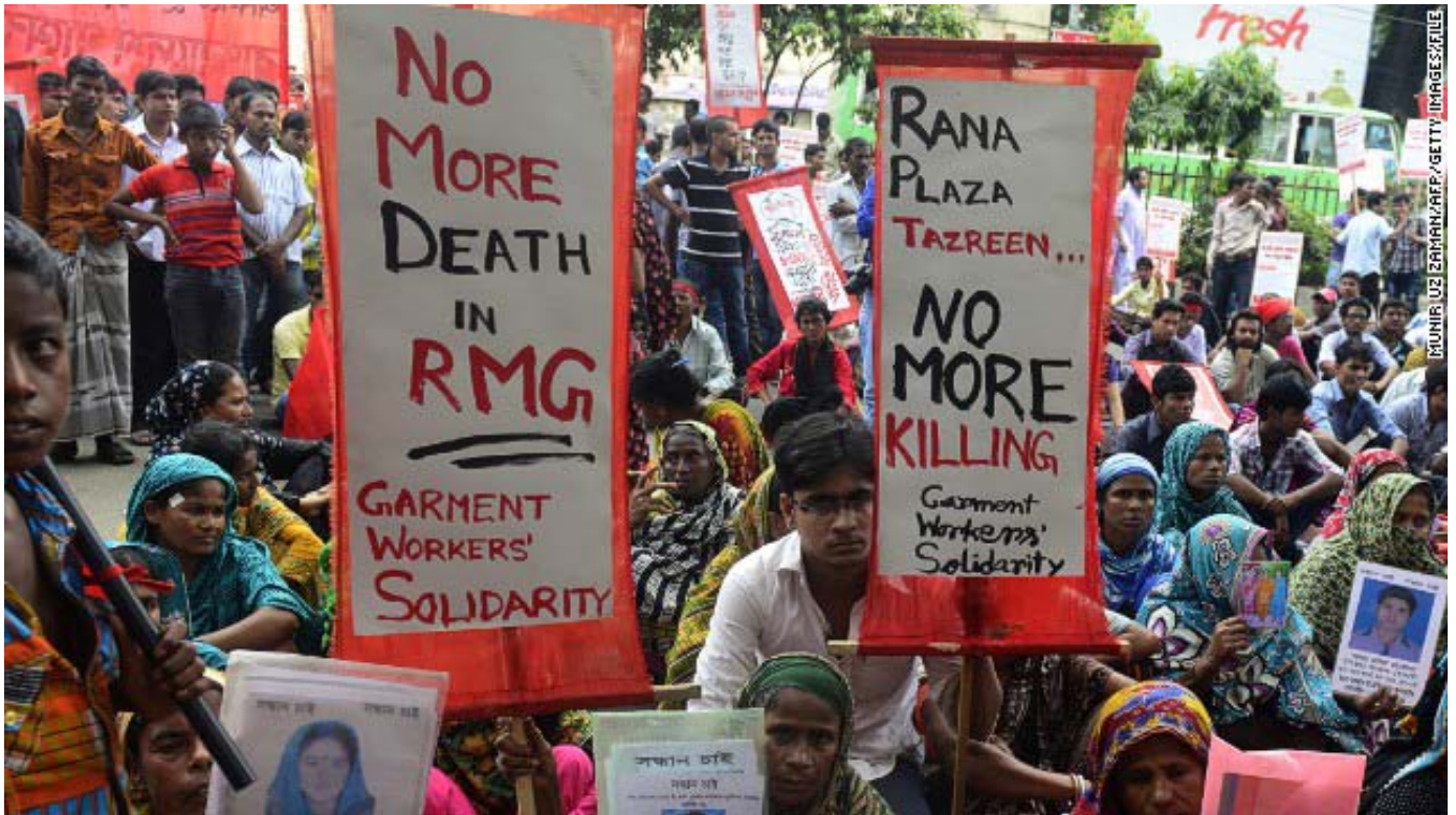
Alrededor de 1300 personas perdieron la vida cuando una fábrica de nueve pisos conocida como Rana Plaza colapsó en Dakha, Bangladesh. La mayoría de los muertos y heridos eran trabajadores del sector textil.

componente es externalizada a diferentes empresas en el extranjero y luego compradas para obtener y comercializar el producto final. Con el fin de maximizar sus utilidades, las compañías externalizan la producción hacia países donde la mano de obra sea más barata, los impuestos más bajos, las regulaciones más permisivas y las posibilidades de litigios o reclamos sean mínimas. Una sola transnacional puede tener cientos o miles de empresas proveedoras.