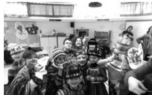
Disfrutando del carnaval boliviano en el Colegio Lourdes