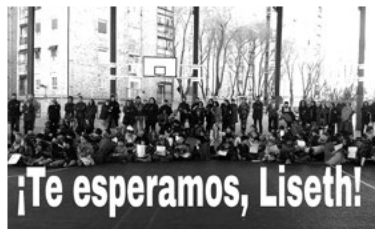
Docentes, familias y alumnado en una de las actividades del proyecto

Por último, queremos enfatizar el carácter marcadamente emocional y afectivo que ha impregnado la participación de docentes, familias, y especialmente de niñas y niños en las actividades de este proyecto educativo.