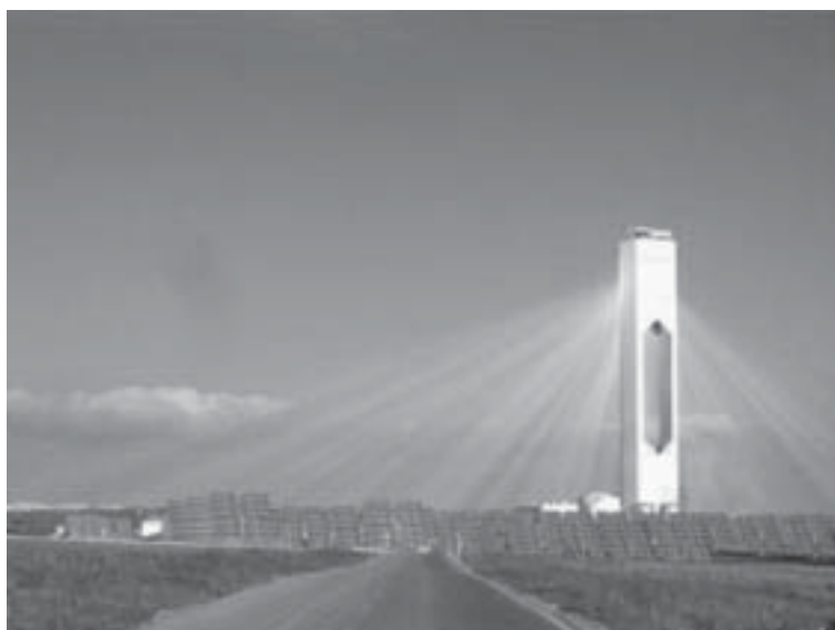
Figura 4. La planta PS10, recién terminada por Solucar, en Sanlúcar la Mayor (Sevilla)

El otro proyecto ya en fase de construcción es el ANDASOL I del grupo ACS Cobra que también tiene el ANDASOL II en situación muy avanzada de permisos oficiales y financiación. Las demás empresas con proyectos están en posiciones muy avanzadas para la realización de sus objetivos en estas tecnologías solares. En algún caso estos proyectos son relativamente «conservadores» desde el punto de vista tecnológico, pero en otros son verdaderamente sugerentes.