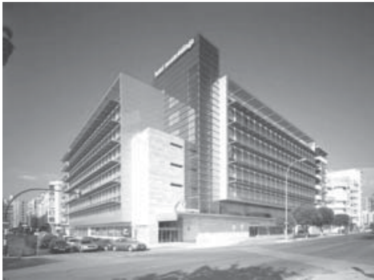
Figura 2. Instalación fotovoltaica en un hotel en Málaga.

Para calentar el agua necesaria en una vivienda, un hotel o un hospital basta con una instalación de energía solar térmica convenientemente dimensionada y realizada. Es evidente que en este caso, desde la fuente energética primaria elegida —el sol— se obtiene directamente el servicio requerido, calentar el agua. No es necesario generar energías intermedias. El proceso es más eficiente.